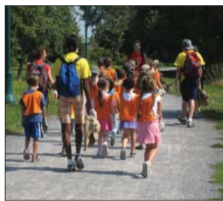
Enfants et animateurs des camps de jour lors de la corvée d'arrachage du 31 juillet.